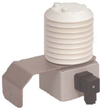
Temperaturgivare med väderskydd rekommenderas vid utomhusbruk