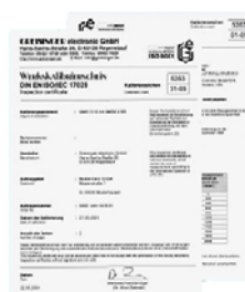
WPF4_WPD5 Kalibreringscertificat för fukt, temperatur, tryck